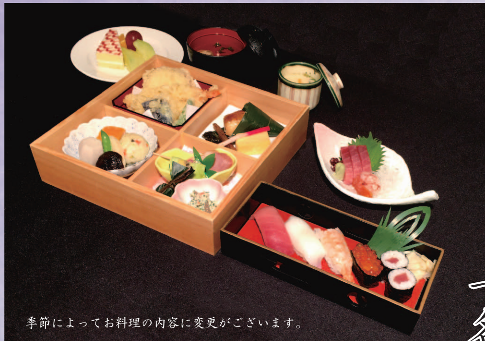
季節によってお料理の内容に変更がございます。